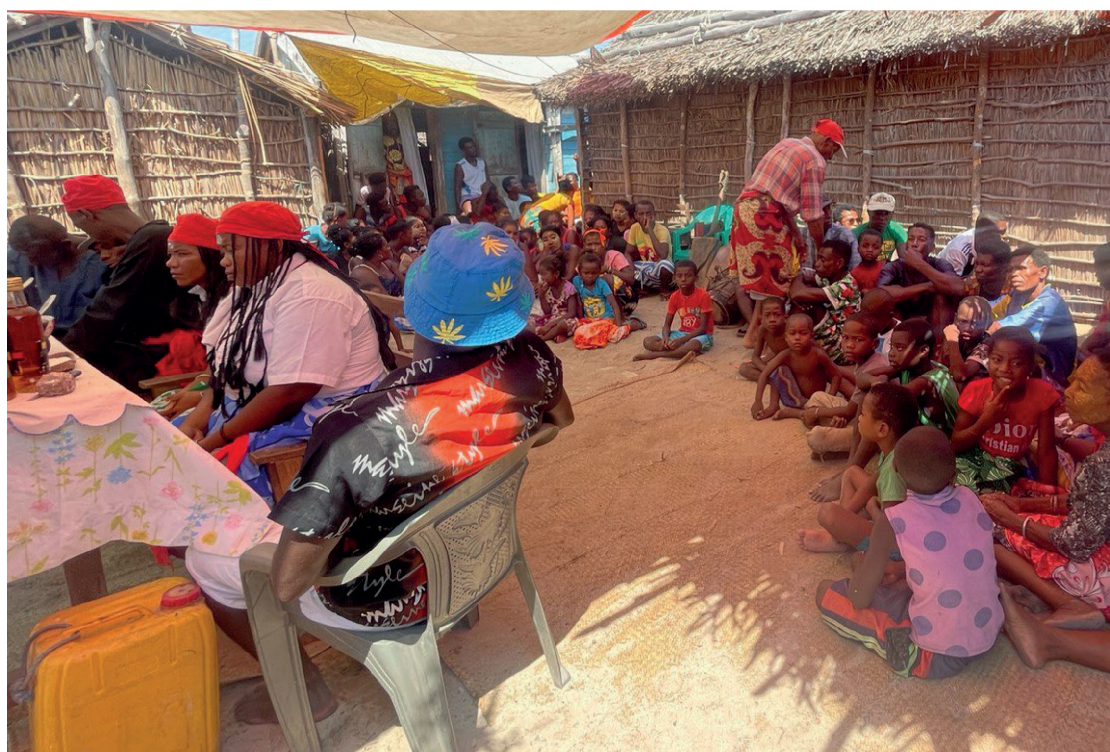
The "tromba", a Malagasy possession ceremony. On the left, three people possessed by "tromba" spirits. La tromba, una cerimonia di possessione malgascia. A sinistra, tre persone possedute da spiriti tromba Amici di Ampasilava.