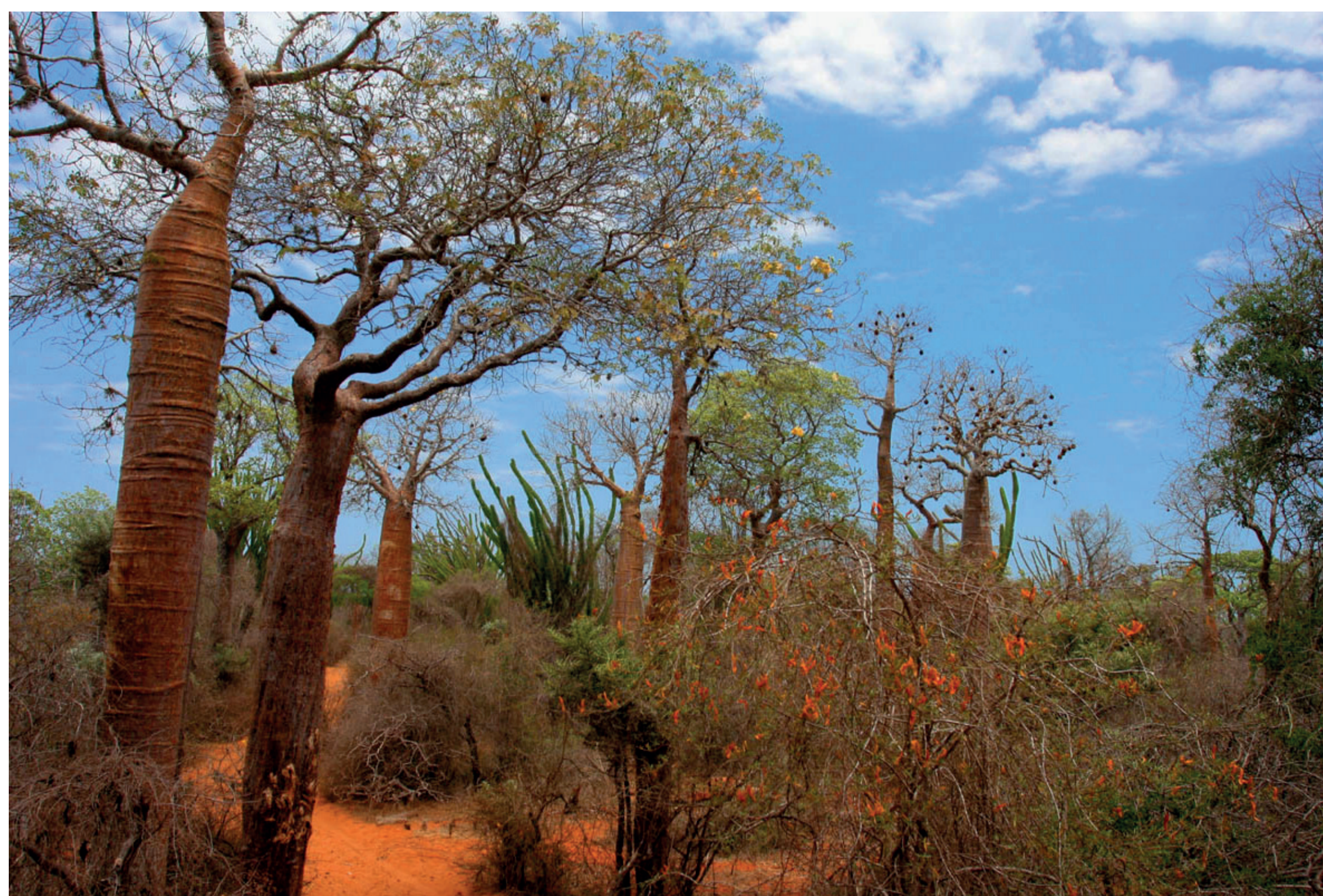
The thorny forest, land of the Mikea. La foresta spinosa, terra dei Mikea, Jialiang Gao