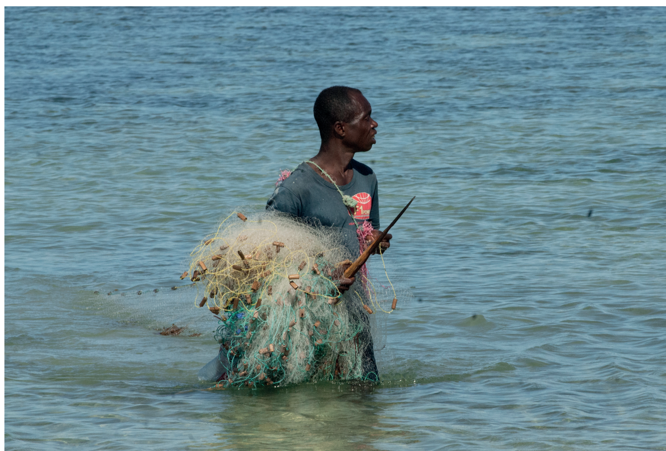
Vezo fisherman spreading his nets. Pescatore Vezo che stende le reti, Amici di Ampasilava.