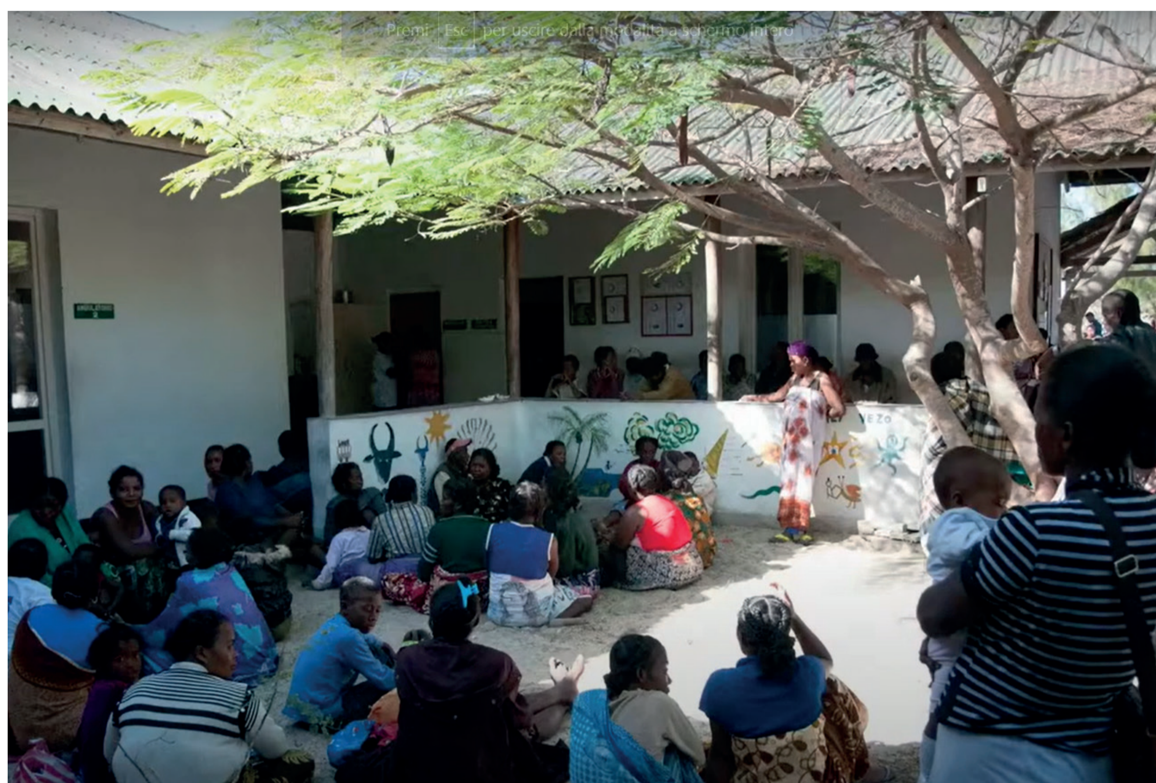
Waiting in front of the hospital entrance is also a moment of sharing. Anche l'attesa davanti all'ingresso dell'ospedale è un momento di condivisione, Amici di Ampasilava