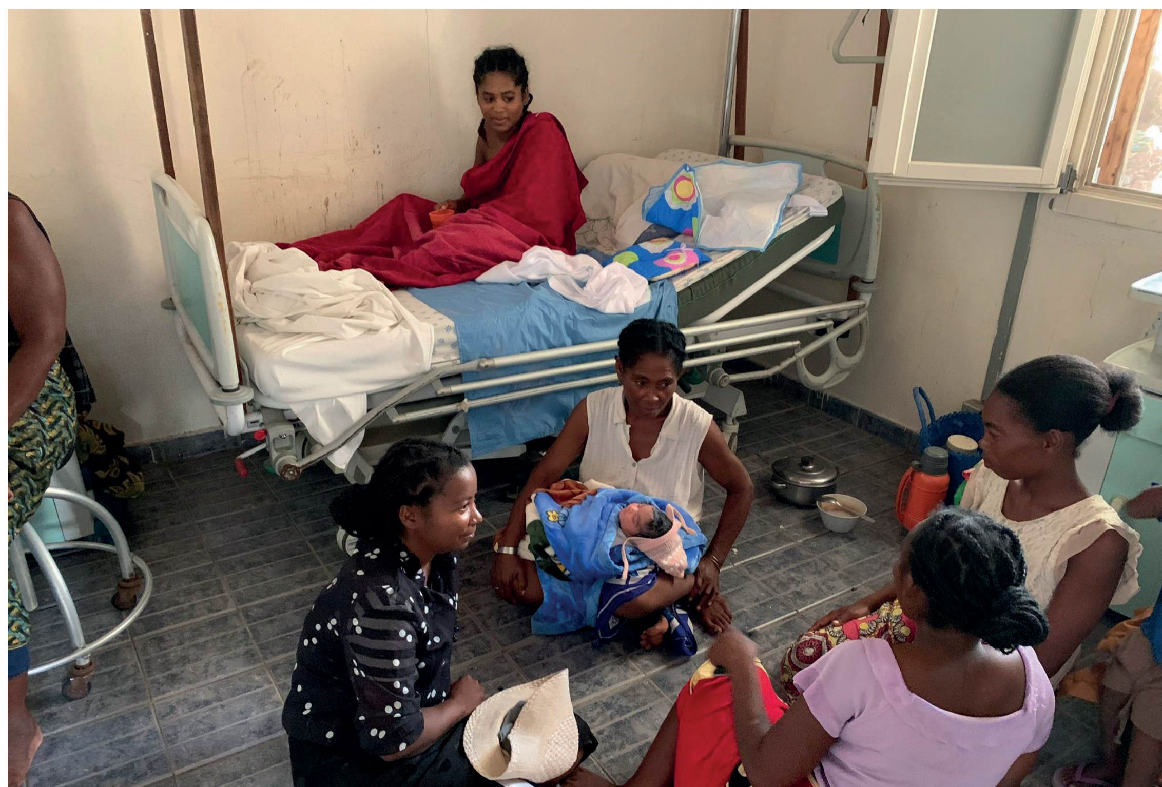
Family life goes on around the hospitalized patient. La vita familiare prosegue naturalmente intorno al paziente ricoverato, Amici di Ampasilava