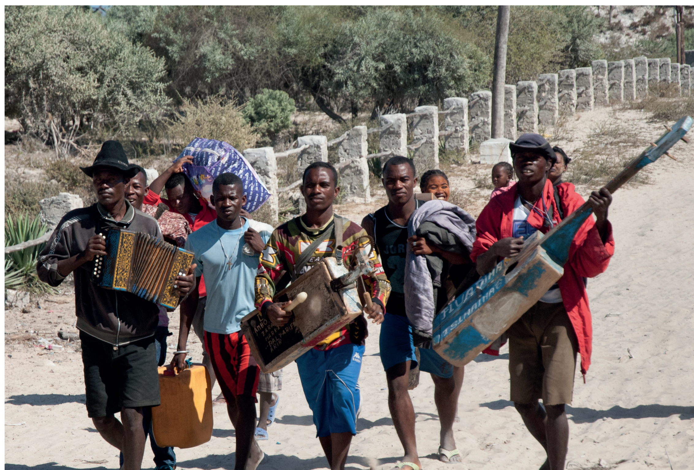
Bilo musicians towards a Masikoro village. A propitiatory ritual for health that lasts three days. Suonatori del Bilo verso un villaggio Masikoro. Un rituale propiziatorio per la salute che dura tre giorni, Amici di Ampasilava