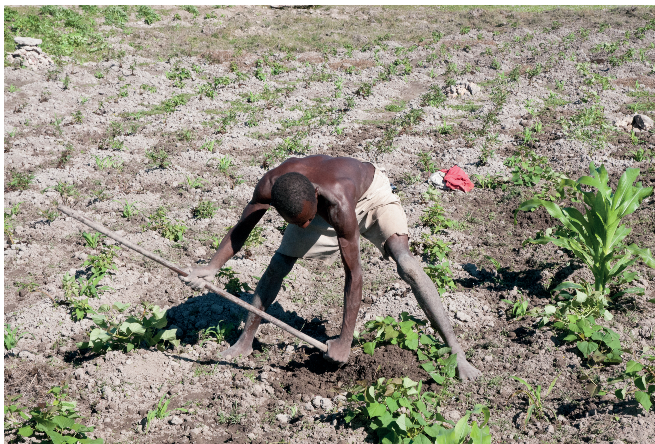
Masikoro at work in the fields with the typical "digging stick". Masikoro al lavoro nei campi con il tipico "bastone da scavo", Amici di Ampasilava